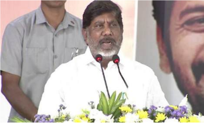
తెలంగాణలో గ్రీన్ ఎనర్జీ ఉత్పత్తిలో ముందంజ యాదాద్రి పవర్ ప్లాంట్ నిర్మాణానికి ఉద్యోగ పత్రాలు ప్రజాభవన్ కార్యక్రమంలో డిప్యూటీ సీఎం భట్టి