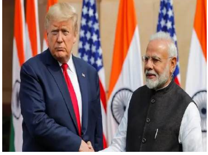
ప్రత్యామ్నాయ కూటమి పురుగు పోసుకుంటోందన్న కామెంట్స్ వినిపించాయి. ఈ క్రమంలో ట్రంప్ మరోసారి స్పందిస్తూ సంచలన కామెంట్ చేశారు. భారత్, రష్యాలను అమెరికా చైనాకు కోల్పోయిందని అన్నారు. వారి భవిష్యత్తు చక్కగా

అమెరికా: కొంతకాలంగా భారత్ పై గురుగా ఉన్న అమెరికా ప్రభుత్వం తీరులో స్పష్టమైన మార్పు మొదలైంది. మోదీ తనకెప్పటికీ స్నేహితుడే అంటూ అగ్రరాజ్య అధ్యక్షుడు డొనాల్డ్ ట్రంప్ తాజాగా తమ స్నేహాన్ని గుర్తు చేసుకున్నారు. భారత్, అమెరికాలది ప్రత్యేకమైన బంధం అని కూడా కామెంట్ చేశారు. ఈ క్రమంలో ప్రధాని నరేంద్ర మోదీ కూడా సానుకూలంగా స్పందించారు. ట్రంప్ వ్యాఖ్యలపై హార్దం వ్యక్తం చేశారు. ఈ విషయంలో తనది ఇదే భావన అని ఎక్స్ వేదికగా పోస్టు పెట్టారు. భారత్, అమెరికా మధ్య సమగ్ర అభివృద్ధికారక వ్యూహాత్మక భాగస్వామ్యం ఉందని అన్నారు భారత్ ఎగ్జిక్యూటివ్ 50 శాతం సుంకం విధించిన అమెరికా ప్రభుత్వం ఆ తరువాత పలుమార్లు బహిరంగ విమర్శలకు దిగిన తెలిసిందే. ముఖ్యంగా ట్రంప్ నకు సన్నిహితంగా ఉండే పలువురు నేతలు కూడా తమ నోటికి పని చెప్పారు. భారత్ మాత్రం హిందూ భారత్ తన అభిప్రాయాన్ని వ్యక్తం చేసింది. కొన్ని సందర్భాల్లో వ్యూహాత్మక మోసం పాటించింది. ఈ క్రమంలో ప్రధాని మోదీ చైనాలో జరిగిన షాంఘాయ్ సహకార సదస్సుకు హాజరయ్యారు. చైనా అధ్యక్షుడు షీ జిన్ పింగ్, రష్యా అధ్యక్షుడు పుతిన్ తో కలిపిడిగా మాట్లాడుతూ కనిపించారు. ఇందుకు సంబంధించిన ఫోటోలు చైనాలోని మూరాయి. పాశ్చాత్య ఆధిపత్యాన్ని ధిక్కరించే