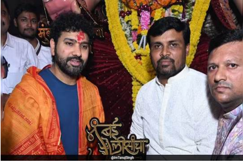
కూడా వార్తలు వస్తున్నాయి. రోహిత్ సన్నబడిన ఫోటోలు మీడియాలో వైరల్ అవుతున్నాయి

టీమిండియా దిగ్గజ అటగాడు, వన్డే కెప్టెన్ రోహిత్ శర్మ తాజాగా ముంబైలోని వర్షిలో సందడి చేశాడు. గణపతి పూజల కోసం ఓ మండపానికి వెళ్లిన రోహిత్ను అతడి అభిమానులు చుట్టముట్టారు. రోహిత్ కారును కదలనివ్వలేదు. దీంతో రోహిత్ కారు సనరూఫ్ నుంచి బయటకు వచ్చి అభిమానులకు అభివాదం చేశాడు. దీంతో అభిమానులు.. 'ముంబైకా రాజా' అంటూ నినాదాలు చేశారు. ఈ వీడియో ప్రస్తుతం సోషల్ మీడియాలో వైరల్గా మారింది. గత నాలుగు నెలలుగా విశ్రాంతి తీసుకుంటున్న రోహిత్ శర్మ అక్టోబర్లో ఆస్ట్రేలియాలో జరగబోయే వన్డే సిరీస్ కోసం సన్నద్ధమవుతున్నాడు. ఇటీవల బెంగళూరులోని సెంటర్ ఆఫ్ ఎక్సలెన్స్లో ఫిట్నెస్ పరీక్షకు హాజరై పాసయ్యాడు. అంతే కాదు.. గత మూడు నెలల కాలంలో రోహిత్ శర్మ ఏకంగా 20 కిలోల బరువు తగ్గినట్లు