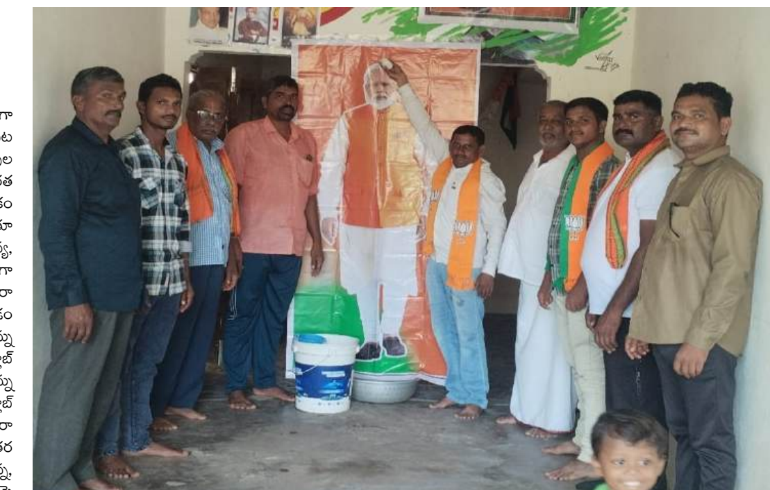
మాత్రమే ఉంటాయని దేశ ఆర్థిక శాఖ మంత్రి నిర్మలా సీతారామన్ అన్ని వర్గాల ప్రజలకు ద్వారా దీపావళి కానుకగా జీఎస్టీ తగ్గించు ఖాతా అందించారని హర్షం వ్యక్తం చేశారు. పేద ప్రజలకు మేలు చేసి, వారి జీవన ప్రమాణాలలో మార్పులు తీసుకువచ్చి, దేశాన్ని అభివృద్ధి పథంలో నడపటమే భారత ప్రధానమంత్రి మోదీ లక్ష్యమని పేర్కొన్నారు. ప్రధాని మోదీ నివాదం సృష్టించే వస్తువులను కొనుగోలు చేసి, మన దేశ వ్యాపా