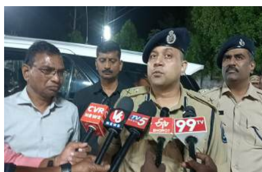
కొనసాగుతుందని ఈరోజు పదివేల పైచిలుకు తో గణపయ్య నిమజ్జన కార్యక్రమాలు జరుగుతున్నాయన్నారు. ఇప్పటివరకు నిమజ్జన కార్యక్రమాల్లో ఎలాంటి ఇబ్బందులు సమస్యలు తలెత్తలేదన్నారు. తో ప్రశాంత వాతావరణంలో నిమజ్జన