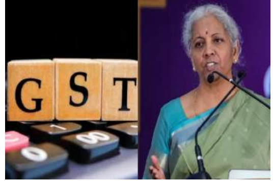
తెలియజేయడానికి 'చౌపల్స్' నిర్వహించాలని ప్లాన్ చేశామని