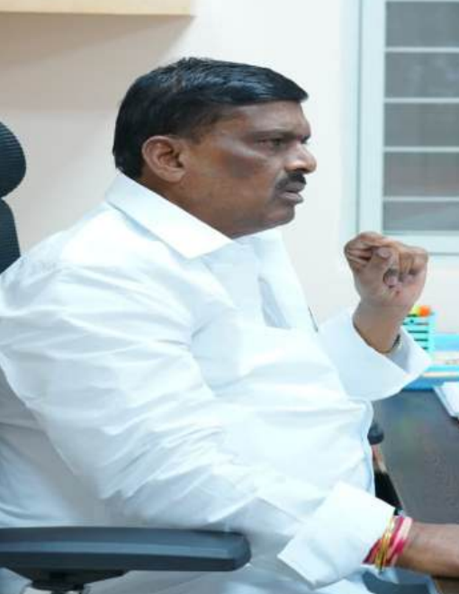
పటాన్ చెరువు ప్రతినిధి సెప్టెంబర్ 11, (నూన్ 9):

అధికారులు.. కాంట్రాక్టర్లు సమన్వయంతో పని చేయాలి.. పనుల్లో నాణ్యత లోపిస్తే అధికారులు..పెన్షన్లపై కలిగిన చర్యలు. ప్రజలకు జవాబుదారీగా పని చేయండి.. నిరంతర పర్యవేక్షణతో సమగ్ర ఫలితాలు.. పటాన్చెరు శాసనసభ్యులు గూడెం మహిపాల్ రెడ్డి జహాన్ ఎంపీ ఇంజనీరింగ్ విభాగం అధికారులు కాంట్రాక్టర్లతో సమీక్షా సమావేశం