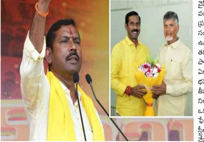
సూపర్ హిట్ సభ దిగ్విజయంగా సాగింది. ప్రభుత్వ సంక్షేమ పథకాలు రాపని బెదిరించి ఈ సభకు తాము తీసుకొచ్చామని అసత్యాలు