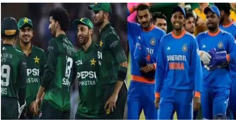
లాంటి మధ్య శ్రేణి టిక్కెట్లు కూడా సగటు ప్రేక్షకుడికి అందుబాటులో లేవు.

దుబాయ్: చిరకాల ప్రత్యర్థులు భారత్, పాకిస్తాన్ మధ్య మ్యాచ్ అంటే టిక్కెట్లు హాట్ కేక్ అమ్ముకుపోతాయి. పహల్గా ఉగ్రదాడి తర్వాత ఈ రెండు జట్లు తొలిసారిగా తలపడ నుండడంతో.. డిమాండ్ భారీగా ఉంటుందని ఆదివారం జరిగే ఇండో-పాక్ మ్యాచ్ టిక్కెట్లు ఇంకా అందుబాటులో ఉండడం అందరినీ ఆశ్చర్యానికి గురిచేస్తోంది. హైవోల్టేజీ మ్యాచ్కు డిమాండ్ తగ్గడానికి అధిక ధరలతో కారణమని తెలుస్తోంది. రెండు సీట్లకు రూ. 10,000 అన్నింటికంటే తక్కువ. వీటిపై రాయల్ టాక్సీలో జతకు రూ. 2,30,700, ప్రైభాక్స్ టిక్కెట్ రూ. 1,67,851గా నిర్ణయించారు. ఫ్లాటినం రూ. 75,658, గ్రాండ్ లాంజ్ రూ. 41,153