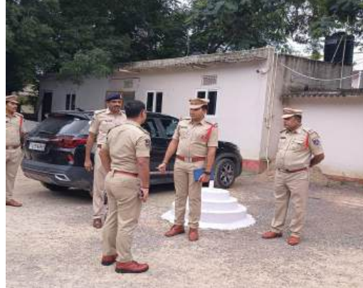
పటాన్ చెరువు ప్రతినిధి, సెప్టెంబర్ 11 (నూన్ 9):

సంగారెడ్డి జిల్లా ఎస్సీ పరిశోధన వంకజ్జే ఐపీఎస్ ఈరోజు అమీన్యూర్ పోలీస్ స్టేషన్ ఆకస్మిక తనిఖీ చేశారు. ఈ సందర్భంగా పోలీస్ స్టేషన్ పరిసరాల పరిశుభ్రత, రికార్డుల నిర్వహణను పరిశీలించారు. అనంతరం పెండింగ్ కేసులు, అందర్ ఇన్వెస్టిగేషన్ కేసుల రికార్డులను పరిశీలించి, లాంగ్ పెండింగ్ కేసుల చేదనకు ప్రత్యేక ప్లాన్ ఆఫ్ యాక్షన్ ఉండాలని సూచించారు. అప్పి సంబంధిత నేరాలు ఎక్కువగా జరుగుతున్న ప్రాంతాలను బ్లాక్ స్థాయి గుర్తించి నిఘా కట్టుడిట్టడం చేయాలని, దైల్ 100 కార్లకు వెంటనే స్పందించాలని ఎస్సీ ఆదేశించారు. స్టేషన్ కు వచ్చే ప్రతి ధరఖాస్తును తప్పనిసరిగా ఆన్లైన్లో సమూహ చేయాలని సూచించారు. సిబ్బందితో మాట్లాడిన ఎస్సీ, ప్రతి ఒక్కరూ అన్ని వర్కల్ విభాగాలలో ప్రావిణ్యత సాధించాలని, సిటిజన్ ఫీడ్ బ్యాక్ కోడ్ స్టేషన్లో కనిపించేలా ఉంచాలని తెలిపారు. స్టేషన్ కు వచ్చే ప్రజలతో మర్యాదగా మాట్లాడి, వారి సమస్యలను ఓపికగా విని తక్షణ న్యాయం చేయాలని సూచించారు. యువత ఆన్లైన్ బెడ్డింగ్, బెడ్డింగ్ యూవ్ల వలలో చిక్కి మోసపోతున్నారని, సైబర్ క్రిమీస్ ముఖ్యంగా పటాన్ చెరువు, అమీన్యూర్ ప్రాంతాల్లో అధికంగా