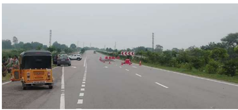
నూన్ 9, సెప్టెంబర్ 13, ఆందోల్ ప్రతినిధి: హైవే రోడ్డుపై గుంతలు పడిన 15 రోజులు అవుతున్న పట్టించుకోని హైవే కాంట్రాక్టర్ హైవేపై ఇన్ని రోడ్డు ప్రమాదాలు జరుగుతున్నప్పటికీ పట్టించుకోకపోవడం వలన ప్రయాణికులు ఇబ్బందిగా మారిందని తెలిపారు, ఇది ఇలా ఉండగా రోడ్డు ప్రక్కనే పండ్లు పెట్టుకొని అమ్ముతున్నారని అక్కడనే వాహనాలు ఆపి పండు కొనుక్కుంటున్నారు, దీనివలన వాహనదారులకు ప్రయాణికులకు ఇబ్బందిగా మారుతుందని ఆయనకు తెలిపారు ఇప్పటికైనా పట్టించుకోని హైవే రోడ్డు తొందరగా వేయాలని కోరుతున్నారు.