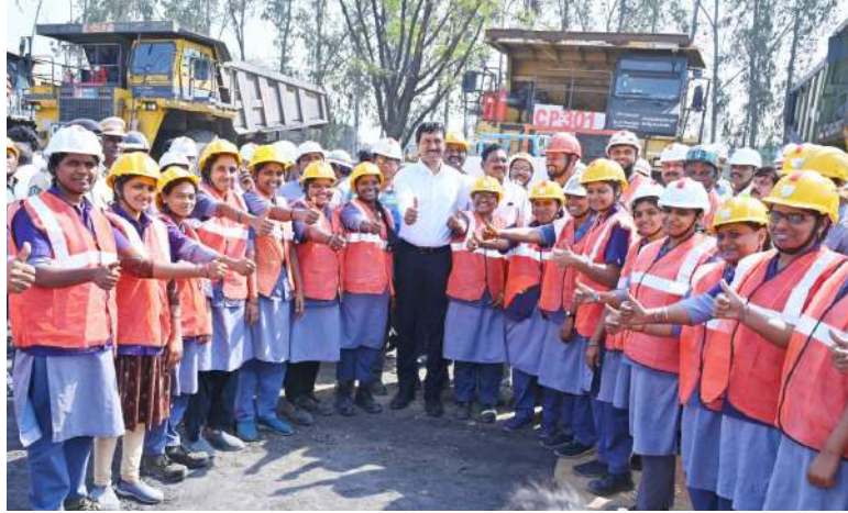
ట్రైని (కేటగిరి-5) హోదాతో సంబంధిత ఏరియాలో పోస్టింగ్ లభిస్తుంది మహిళా ఉద్యోగులు ఈ చారిత్రాత్మక అవకాశాన్ని సద్వినియోగం చేసుకోవాలని జమాన్యం కోరుతోంది.

భద్రాద్రి కొత్తగూడెం బ్యూరో సెప్టెంబర్ 13 (నూన్-9): సింగరేణి యాజమాన్యం ఓపెన్ కాస్ట్ గనుల్లో భారీ యంత్రాలపై మహిళా ఆపరేటర్లను నియమించడానికి దరఖాస్తులను ఆహ్వానిస్తోంది. సీఎండీ ఎస్. బలరామ్ ఆదేశాల మేరకు మైనింగ్ రంగంలో మహిళా సాధికారత, సమాన అవకాశాల దిశగా ఈ వినూత్న నిర్ణయం తీసుకున్నారు. ఈ మేరకు శనివారం అన్ని ఏరియాలకు, విభాగాలకు సర్క్యులర్ జారీ అయింది. సింగరేణి చరిత్రలో ఇదే తొలిసారి మహిళలకు భారీ యంత్రాల ఆపరేటర్ అవకాశంలో అవకాశం కల్పించడం ప్రత్యేకత. ప్రస్తుతం సింగరేణి సంస్థలో జనరల్ అసిస్టెంట్ / బదిలీ వర్కర్ గా పనిచేస్తుండాలి వయసు 35 సంవత్సరాల లోపు, విద్యార్హత కనీసం 7వ తరగతి ఉత్తీర్ణత శారీరక సామర్థ్యం కలిగి ఉండాలి. కనీసం 2-వీలర్ లేదా 4-వీలర్ డ్రైవింగ్ లైసెన్స్ తప్పనిసరి ఆగస్టు 2024లోపు పొందిన లైసెన్స్ కలిగిన వారికి ప్రాధాన్యత, అభ్యర్థులు సంబంధిత గెని మేనేజర్ / శాఖాధిపతి / జనరల్ మేనేజర్ కు అప్లికేషన్ సమర్పించాలి జనరల్ మేనేజర్ (సి పి పి) నేతృత్వంలోని కమిటీ పరిశీలించి అర్హులను ఎంపిక చేస్తుంది ఎంపికైన వారు సినిస్టిలోని తెలంగాణ ఇన్స్టిట్యూట్ ఆఫ్ డ్రైవింగ్ ఎడ్యుకేషన్ అండ్ సిల్స్ లో శిక్షణ పొందాలి శిక్షణ పూర్తయ్యాక నిర్వహించే ఎంపిక పరీక్షలో ఉత్తీర్ణత సాధించిన వారికి ఈ పి ఆపరేటర్