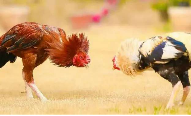
జరుగుతున్నాయి. కోడిపందేలు, కోత మక్కలో లక్కలాది రూపాయలు చేతులు మారుతున్న పరిస్థితి, బరులు జాతరను తలపిస్తున్నాయి. హెయిరాహెయిగా కోడి పందేలు జరుగుతున్నాయి.

అమరావతి, జనవరి 14: రాష్ట్ర వ్యాప్తంగా సంక్రాంతి పండుగ సందర్భంగా కోడి పందేలు జోరుగా సాగుతున్నాయి. సంప్రదాయంగా భావించే ఈ కార్యక్రమాలు ముఖ్యంగా తూర్పు గోదావరి, పశ్చిమ గోదావరి, కృష్ణా, ఏలూరు, కాకినాడ, అనకాపల్లి తదితర ప్రాంతాల్లో పెద్దపెత్తున జరుగుతున్నాయి. చాలా ప్రాంతాల్లో కోడి పందేలకు బరులు ముస్తాబయ్యాయి. ఈ పందేలను చూసేందుకు దూరప్రాంతాల ప్రజలు సైతం పెద్దపెత్తున తరలివస్తున్నారు. బరుల్లో ఎల్కాడీ స్త్రీలను ఏర్పాటు చేశారు నిర్వాహకులు. అయితే.. గతంలో లాగానే ఈసారి కోట్ల రూపాయల్లో పందేలు జరుగుతున్నట్లు తెలుస్తోంది. అంబేద్కర్ కోసినీమ జిల్లా అమలాపురంలో కోడిపందేలు, గుండాటలు ప్రారంభమయ్యాయి. ప్రతి గ్రామంలోనూ కోడిపందేలు, గుండాటలు ఏర్పాటుయ్యాయి. 'మాడు బరులు.. ఆరు బోర్డులు' అన్నట్లు నిర్వాహకులు ఏర్పాటుచేశారు. జిల్లా వ్యాప్తంగా దాదాపు 150కి పైగా కోడిపందేలు బరులు ముస్తాబయ్యాయి. గుడివాడ నియోజకవర్గంలో సంక్రాంతి కోడిపందేలు పెద్దపెత్తున