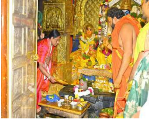
బనవోలు, జనవరి 14, 2026.