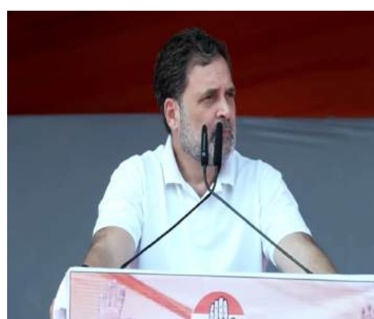
ఉన్నప్పటికీ, అప్పటి ప్రధాని స్పందించలేదని, ఆర్మీ చీఫ్ ను

భోపాల్ : యుద్ధ నిర్ణయాల నుంచి అంతర్జాతీయ వాణిజ్య ఒప్పందాల వరకు అన్ని అంశాల్లో ప్రధాని నరేంద్ర మోడీ ఏకపక్షంగా వ్యవహరిస్తున్నారని కాంగ్రెస్ అగ్రనేత రాహుల్ గాంధీ ఆరోపించారు. దేశ భద్రత, రైతుల ప్రయోజనాలు, పార్లమెంటరీ వ్యవస్థ అన్నీ ప్రమాదంలో పడుతున్నాయని అన్నారు. మధ్యప్రదేశ్ లోని భోపాల్ వేదికగా జరిగిన రైతు మహావేషాల్ సభలో పాల్గొన్న రాహుల్, ఈ మేరకు కేంద్ర ప్రభుత్వంపై ఘాటు విమర్శలు చేశారు. ప్రధాని స్పందించలేదు: రాహుల్ మాజీ ఆర్మీ చీఫ్ ఎంఎం నరవణ్ తన వ్యవస్థలోని చేసిన వ్యాఖ్యలను ప్రస్తావించిన రాహుల్, చైనా ట్యాంకులు సరిహద్దుల్లోకి వచ్చినప్పుడు ఆదేశాలు కోసం రక్షణ మంత్రికి ఫోన్ చేసినా స్పందన రాలేదని నరవణ్ రాశారుని చెప్పారు. రక్షణ మంత్రి రాజ్ నాథ్ సింగ్, జాతీయ భద్రతా సలహాదారు అజిత్ ఢోబాల్, విదేశాంగ మంత్రి ఎన్ జైలంకర్ ఎవరూ స్పందించలేదని ఆయన పేర్కొన్నారుని తెలిపారు. చివరికి యుద్ధ నిర్ణయం ప్రధాని తీసుకోవాల్సి