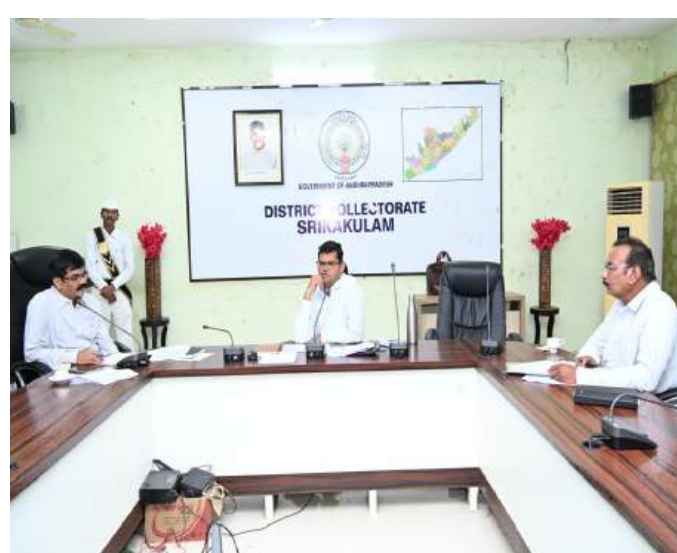
ఆయన వీడియో కాన్ఫరెన్స్ ద్వారా సమీక్ష నిర్వహించారు. ఈ పాల్గొన్నారు.