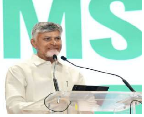
డాక్టర్ బి.ఆర్. అంబేద్కర్ కళావేదికను ప్రారంభించిన సీఎం అంతకుముందు.

వెల్లడించారు.ఎంఎస్ఎంఈ రంగానికి ప్రభుత్వం అత్యంత ప్రాధాన్యత ఇస్తోందని చంద్రబాబు తెలిపారు. వ్యవసాయం తర్వాత అత్యధిక ఉద్యోగాలు కల్పిస్తున్న ఈ రంగాన్ని ప్రోత్సహించేందుకు ఎంఎస్ఎంఈ పాలిసీతో పాటు ప్రైవేట్ పారిశ్రామిక పార్కుల పాలిసీలను తీసుకొచ్చామన్నారు. ప్రతి నియోజకవర్గంలో ఒక ఎంఎస్ఎంఈ పార్క్ ఏర్పాటు చేయాలని నిర్ణయించామని, ఇప్పటికే 100 పార్కులకు శంకుస్థాపన చేశామని చెప్పారు. 'పన్ ఫ్యామిలీ, పన్ ఎంటర్ప్రెనయర్' లక్ష్యంగా పనిచేస్తున్నామని, ఈ ఏడాది 5 లక్షల మంది ద్వారా మహిళలను పారిశ్రామికవేత్తలుగా మారుస్తామని ప్రకటించారు. రాష్ట్రం నుంచి 100 యునికార్న్ల సంస్థలను ఏర్పాటు చేయడమే లక్ష్యమని ఆయన పేర్కొన్నారు.