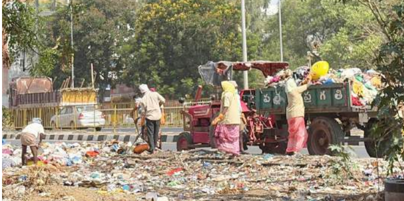
ఈ సందర్భంగా సర్పంచ్ మాట్లాడుతూ కేవలం అధికారులు, సిబ్బంది వల్లనే గ్రామం శుభ్రపడదని ఇందులో ప్రతి ఒక్క పౌరుడి భాగస్వామ్యం అవసరమని పేర్కొన్నారు. ఇళ్లలోని చెత్తను రోడ్ల మీద లేదా ఖాళీ స్థలాల్లో వేయడం వల్ల దోమలు పెరిగి, అంటువ్యాధులు ప్రబల అవకాశం ఉందని ఆందోళన వ్యక్తం చేశారు. గ్రామ పంచాయతీ సిబ్బందికి సహకరించి, మన గ్రామాన్ని ఆదర్శ గ్రామంగా తీర్చి దిద్దడానికి ప్రజలు కలిసిరావాలన్నారు.