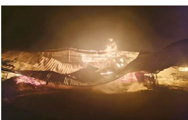
వెంటనే కొండాపూర్ పోలీస్ సిబ్బంది వెళ్లి పైర్ సర్వీసులకు సమాచారం ఇవ్వగా పైర్ సిబ్బంది సంఘటన స్థలానికి చేరుకుని