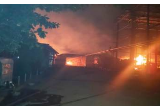
న్యూస్ 9 కొండాపూర్ : కొండాపూర్ మండల పరిధిలోని గుంతపల్లి గ్రామ శివారులో ఉన్న హేమా ఇండస్ట్రీస్ (ప్లెవుడ్) పరిశ్రమలో శనివారం అగ్ని ప్రమాదం జరిగింది. మంటలు చెలరేగి అగ్ని ప్రమాదం సంభవించింది. అగ్ని ప్రమాద సమాచారం అందిన వెంటనే కొండాపూర్ పోలీస్ సిబ్బంది వెళ్లి పైర్ సర్వీసులకు సమాచారం ఇవ్వగా పైర్ సిబ్బంది సంఘటన స్థలానికి చేరుకుని