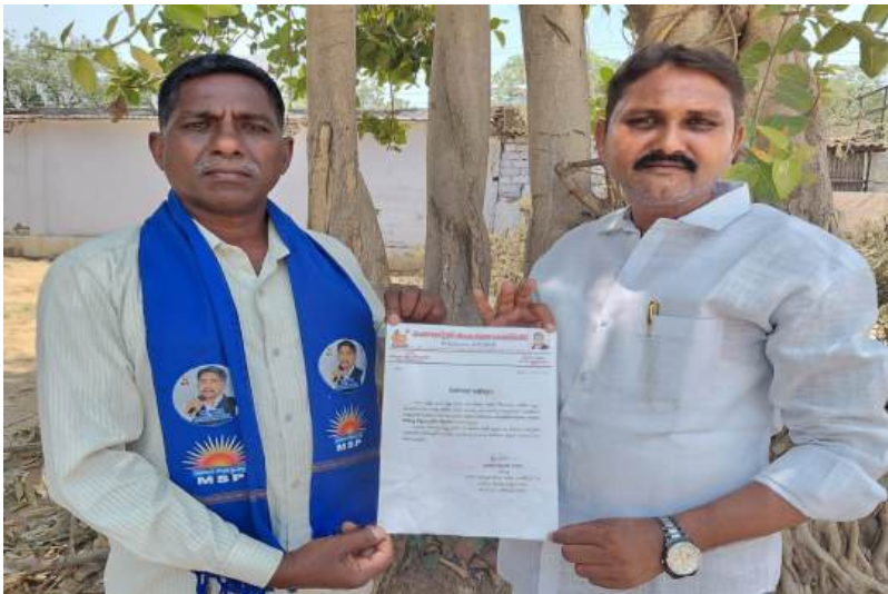
పెద్దపల్లి/గోదావరిఖని, మే 3, న్యూస్ 9 :