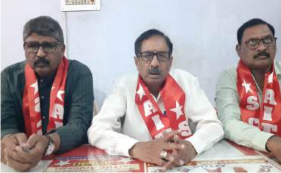
యాజమాన్యంతో, రాష్ట్ర ప్రభుత్వం దృష్టికి తీసుకెళ్ళినప్పటికీ గత ఏడేనిమిది నెలల నుంచి పరిష్కారం చూపకుండా యాజమాన్యం, రాష్ట్ర ప్రభుత్వం నిర్లక్ష్యం చేయడం జరుగుతుందని వారు ఆరోపించారు. గుర్తింపు సంఘం ఎన్నికైన జరిగిన తర్వాత నలుగురు డైరెక్టర్ లు, ఇద్దరు సి.ఇ.ఓ. ఎం.డి లు , జి.ఎం.వర్సనల్ అధికారులు మారారని, దీని వల్ల కార్మిక సమస్యలు పరిష్కారం కావడం లేదని, రాష్ట్ర ప్రభుత్వం కూడా కార్మికుల సమస్యలను పరిష్కరించేందుకు ముందుకు రావడం లేదని వారు ఆరోపించారు. ముఖ్యంగా గతంలో జరిగిన డ్రెస్కో సమావేశాల్లో ఒప్పుకున్న వాటిని అమలు చేయడం లేదని, అదేవిధంగా మెడికల్ టోర్లు ను నిర్వహించడం లేదని, దీని కారణంగా చాలా మంది కార్మికులు తీవ్ర అనారోగ్యంతో బాధపడుతూ ఆర్థిక ఇబ్బందుల్లో ఉన్నారని వారు పేర్కొన్నారు.