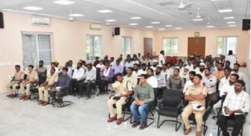
పెద్దపల్లి బ్యారీక్, మే 8, నూన్ 9 :