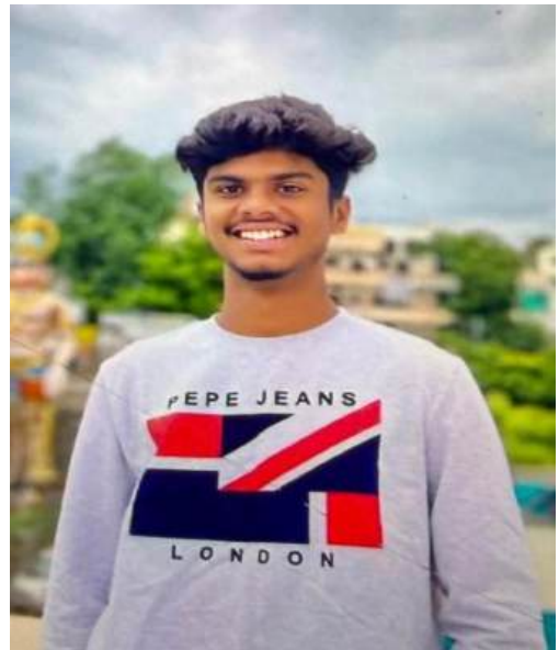
సికింద్రాబాద్, మే 8

సికింద్రాబాద్ వాహునిగూడలో ఓ టీ. టెక్ విద్యార్థిని ఎనిమిది మంది యువకులు దారుణంగా హత్య చేశారు.